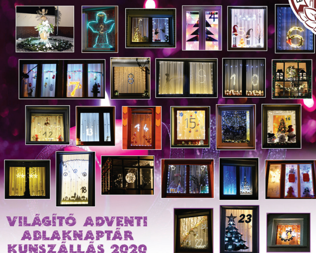
VILÁGÍTÓ ADVENTI ABLAKNAPTÁR KUNSZÁLLÁS 2020