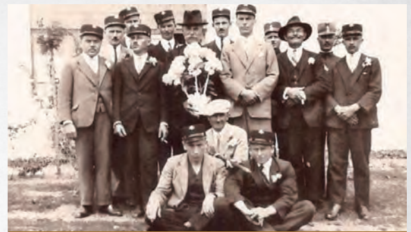
TŰZOLTÓ EGYLET 1920-AS ÉVEK

Szeretettel várunk minden érdeklődőt a kiállítás megnyitójára!