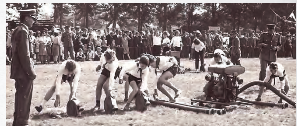
TŰZOLTÓ VERSENY 1966. 05. 22.