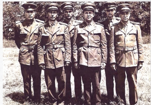
TŰZOLTÓK 1980-AS ÉVEK